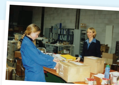
DE START VAN EUROTEC OOK NELLYETTE (R), AAT'S VROUW, HIJLP MEE.