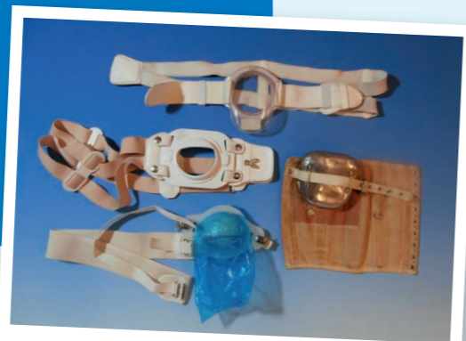
OUDE STOMA MATERIALEN