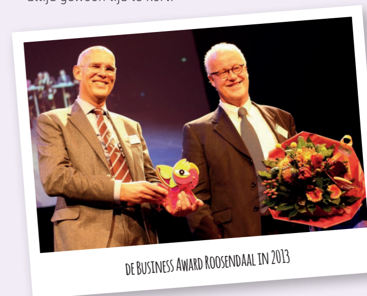
DE BUSINESS AWARD ROOSEDAAL IN 2013

Ik kan mij heerlijk vermaken met uliem niets doen, maar ook met klussen, tuinieren, reizen, kunst en antiek, modelbouw, noem maar op! Ik kom dus nog altijd gewoon tijd te kort!