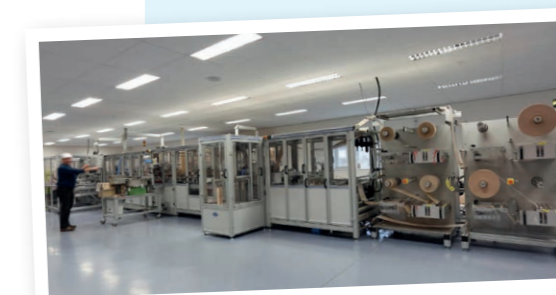
DE AUTOMATISCHE MACHINE